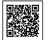
違反対象物公表制度